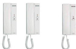
Citófono KDP -602A/D